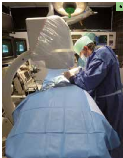
Figuur 6: Ballon-dilatatie valvuloplastie van een pulmonalisstenose.