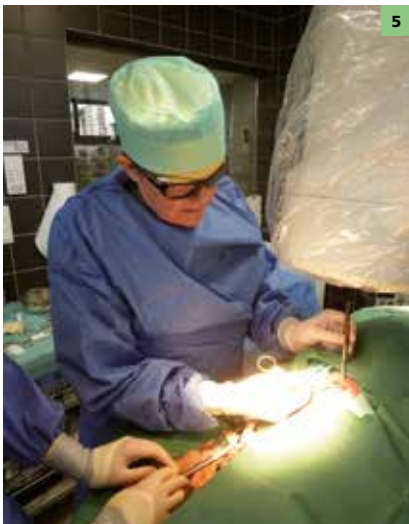
Figuur 5: Transjugulaire pacemakerimplantatie onder fluoroscopische monitoring.